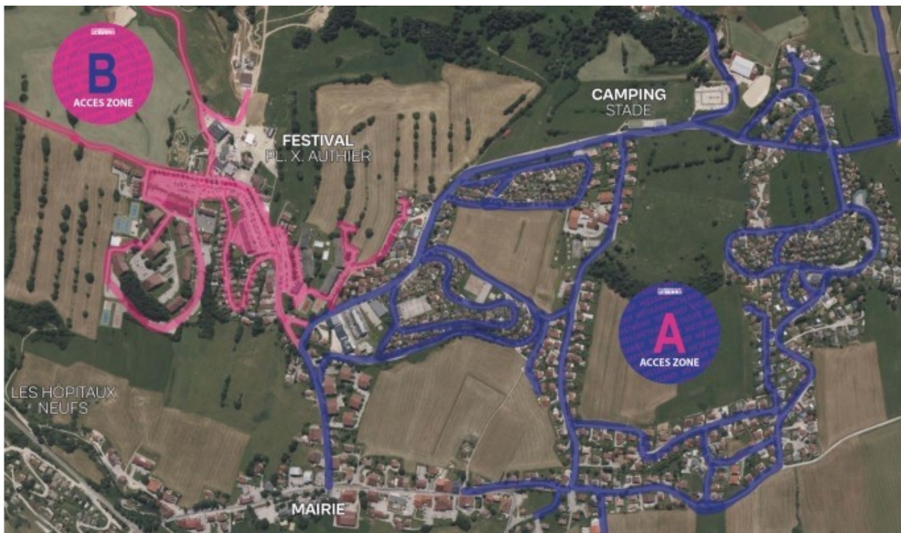
Accès zone riverain

L'accès au village par la rue du Télésiège et la rue des Champs Coiteux se fera sur présentation d'un laissez-passer. Le dispositif de filtrage sera mis en place le vendredi 26 juillet 2024 de 14h à 3h le lendemain, samedi 27 juillet 2024 de 14h à 3h le lendemain, et le dimanche 28 juillet 2024 de 14h à 3h le lendemain.